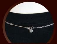
服と服の間で挟む だけでズレなくなります