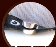
服のタグがある場合は タグに挟んで留める