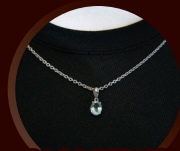
服の上から服の外側 から身に付ける場合