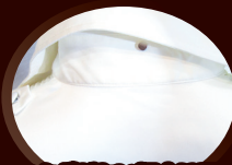
服のタグがない場合は服と服 の間で挟み襟の内側に留める